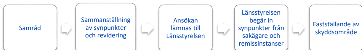
Figur 4. Viktiga hållpunkter för framtida arbetsprocess

Kommunfullmäktige i Sölvesborg ska fatta beslut om att ställa sig bakom förslaget innan ansökan lämnas till länsstyrelsen.